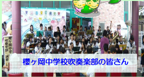
櫻ヶ岡中学校吹奏楽部の皆さん