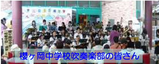
櫻ヶ岡中学校吹奏楽部の皆さん