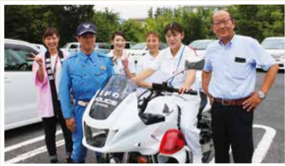
▲初めて県警の緊急車両体験を行いました。