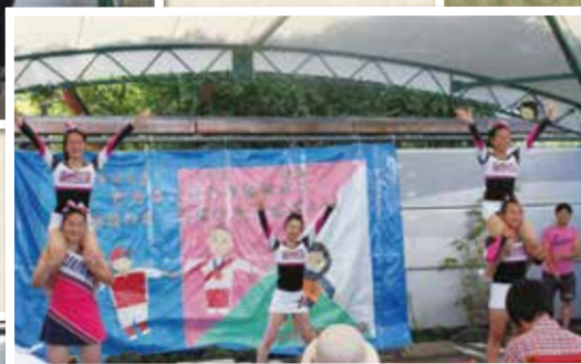
▲アクロバティックチアダンス!