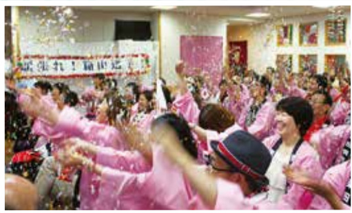
▲銅メダル獲得で歓喜の紙吹雪舞う応援会場。