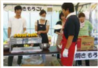
▲毎年恒例の焼きもろこし 仕込み中。