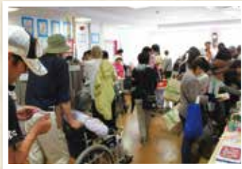
▲バザーは毎回開会直後から超満員です。