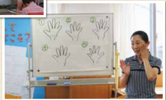
▲カムカムプロジェクトの大井歯科医師。