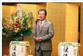
▲代表発起人 加藤市長