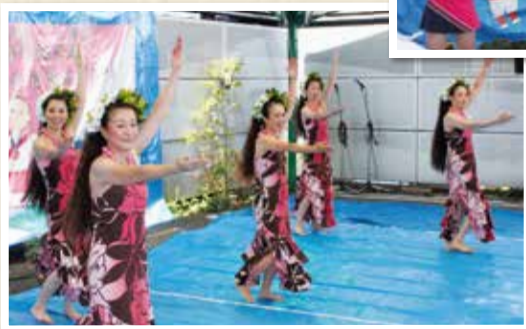
▲フラダンスの優雅な踊りに魅了されました。