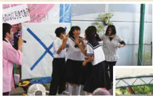
▲〇×を答えて生き残れ、新企画クイズ大会!