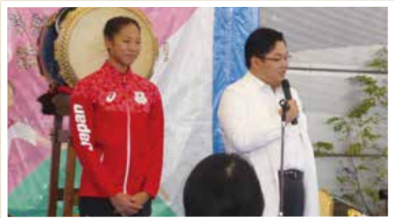
▲箱山選手と開会式の院長挨拶。