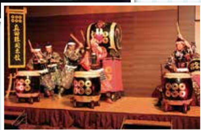
真田勝ちどき太鼓▶