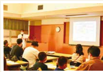
医師によるアルコール依存症についての公開講座