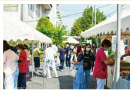
屋台がにぎわっていました