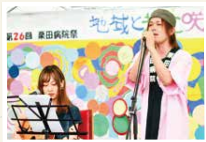
実行委員長による弾き語りライブ