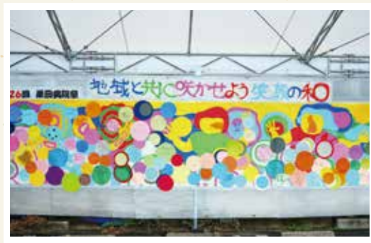
来場者参加型で完成したステージバック

令和6年9月7日、8日に第26回栗田病院祭が開催されました。今回はテーマを「地域と共に咲かせよう笑顔の和」とし、5年ぶりに外来患者さんやご家族、地域の方にもお越しいただける病院祭となりました。屋台では恒例の焼きそばや焼きとうもろこし、アイスクリームなどの販売があり、大いににぎわっていました。また今回はステージイベントやバザーが復活し、普段とは違うお祭りの雰囲気を楽しむ患者さんたちの姿が見られました。